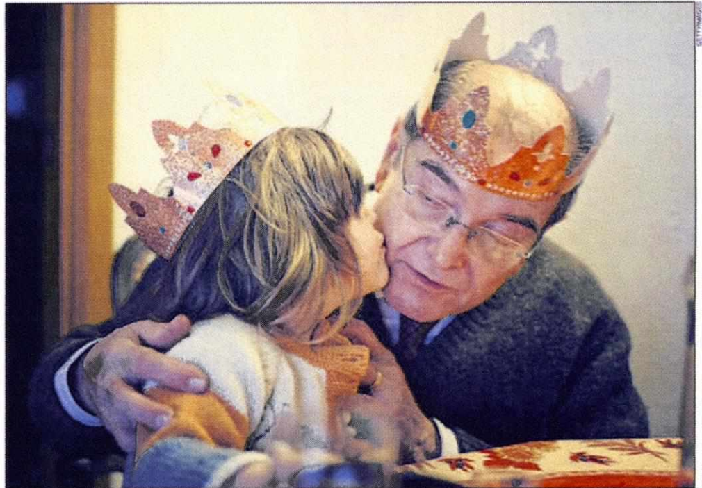
Der neue Impfplan empfiehlt Erwachsenen, die mit Kindern in Kontakt kommen, sich gegen Keuchhusten impfen zu lassen.

Auch bei den Impfungen gegen Pneumokokken und Meningokokken